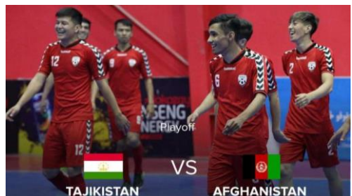
تیم ملی فوتسال زیر ۲۰ سال کشور با پیروزی ۴ بر ۱ در برابر تاجیکستان، به مرحله نهایی مسابقات جام ملت های آسیا راه یافت. در این دیدار که ظهر دیروز و در مرحله پلی آف برگزار شد،